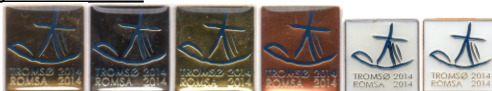
Tø1,b Tø2,b Tø3,b Tø4,b Tø5,b Tø6,b