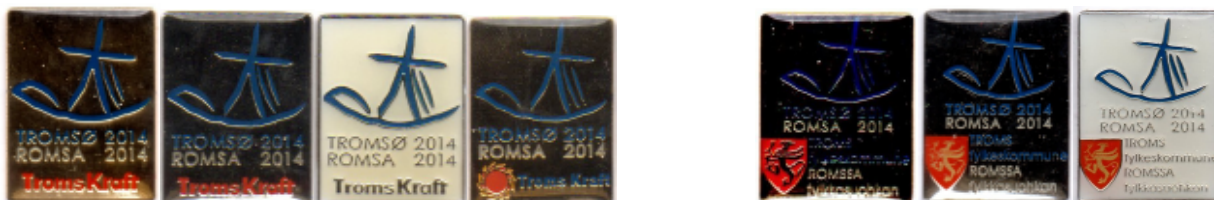
Tø19 Tø20 Tø21 Tø22,b Tø23,b,c Tø24 Tø25,b