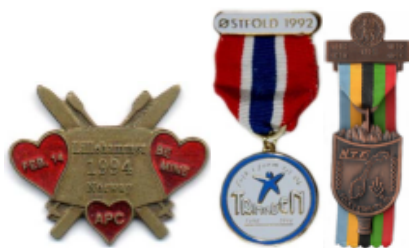
Q9 % Q809 % Q814