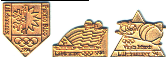
Alle tre bildene her viser den falske versjonen.

Originalen av disse tre gull-pinsene ble solgt samlet i sett på 3 (100 ex) under Lillehammer-OL og har vært svært vanskelig å finne. Trolig derfor har det dukket opp forfalskninger på QXL ca.2002/2003 i tilsynelatende ubegrensede mengder, men da med en helt annen bakside.