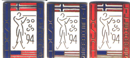
Ekte til venstre, falsk i midten og til høyre

Den ekte finnes bare i blå versjon, den falske finnes i både blå og rød versjon.