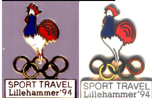
Ekte til venstre, falsk til høyre

Hanen's bein er for korte på den falske. Det er små avvik i skrifttypen. Det høye nedre beinet i R i TRAVEL er litt for kort. L i Lillehammer har for stor hake i nedre høyre hjørne. Bokstaveh h og a i Lillehammer har ulik form. 9-tallet i 94 er ulikt, den øvre åpne delen er tilnærmet sirkelrund på den ekte. 4-tallet i 94 er også ulikt, den åpne trekanten er mindre på den ekte. Produsert ca.2002/2003, mange er solgt på QXL. Mål ekte : høyde ca.26 mm, bredde ca.19,5 mm, tykkelse ca.1,3 mm, falsk : høyde ca.26 mm, bredde ca.19,6 mm, tykkelse ca.1,5 mm (tykkelsen er målt over ringene)