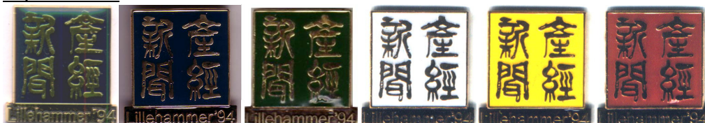
Ekte til venstre, resten er falsk

Den ekte er bare laget i sort farge. Den falske er laget i både sort, grønn, hvit, gul, rød. Lillehammer starter helt klint nederst i venstre hjørne på den ekte, det gjør ikke de falske. På den ekte er bokstaven i i Lillehammer plassert litt lavere enn etterfølgende ll. Apostrofens øvre punkt er for lite på den falske. Den nedre delen av 9-tallet har fått for stor krumming oppover på den falske. Små detaljer i Fuji-logoen er ulike, spesielt de to symbolene på høyre side. Produsert ca.2002/2003, solgt på QXL. Mål ekte : høyde ca.21,8 mm, bredde ca.21,2 mm, tykkelse ca.1,8 mm (uten epoxy)