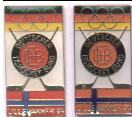
Ekte til venstre, falsk til høyre

Den falske har mørkere blå farge i det norske flagget, den er noe større, 4-tallet i 94 er lukket, men åpen på den ekte (ikke så lett å se på bildene). Produsert ca.2002/2003, mange er solgt på QXL