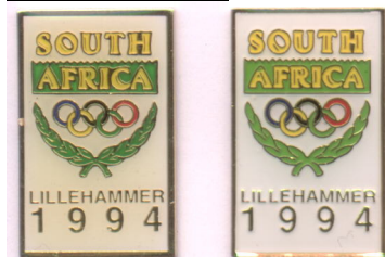
Ekte til venstre, falsk til høyre

Den falske er tykkere, grønnfargen er for skarp/lys. Bokstaven I og C i Africa henger sammen I et gullfelt på den ekte, slik er det ikke på den falske. Andre små detaljer er også ulike, blant annet laurbærbladene. Produsert ca.2002/2003, mange er solgt på QXL