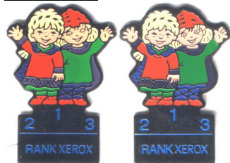
Ekte (fra innrammet sett) til venstre, falsk til høyre

Den ekte ble bare produsert i et antall på 500 og distribuert i innrammede sett. Har du fått tak i denne løst etter 2000, er nok sjangsen stor for at du har den falske. Bildene ovenfor er fra samme scan og ulikhetene kan lett sees. Kristin's hår (fasong og diadem) er ulikt. Blåfargen i Kristin's klær og Håkon's bukser er ulik, det samme med 1 2 3 og RANK XEROX. Teksten RANK XEROX er også noe større på den falske, 3-tallet er for mye lukket, spesielt den øvre delen og 1-tallet har fått for stor hake øverst. Den fiolette nedre delen av Kristin's kjole har for store bølger på den falske. Produsert ca.2002/2003, mange er solgt på QXL. Mål ekte : høyde 30,0 mm, bredde 20,8 mm, tykkelse 0,8 mm, bredde på pallen 15,3 mm, falsk : høyde 29,9 mm, bredde 20,8 mm, tykkelse 0,75 mm, bredde på pallen 15,1 mm