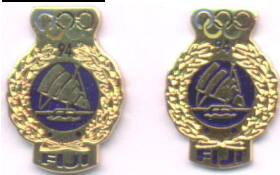
Ekte til venstre, falsk til høyre

Den falske er noe lavere og noe smalere. En stripe/detalj mangler i nedre/midtre del av seilet. Fiji er med større skrift på den falske, OL-ringene er plassert for nært kanten, 94 er plassert for høyt oppe. Produsert ca.2002/2003, mange er solgt på QXL