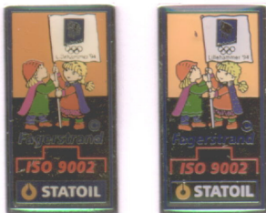
Ekte til venstre, falsk til høyre

Denne pinsen ble aldri godkjent. Den var laget i et begrenset antall og vanskelig å finne inntil den falske dukket opp.