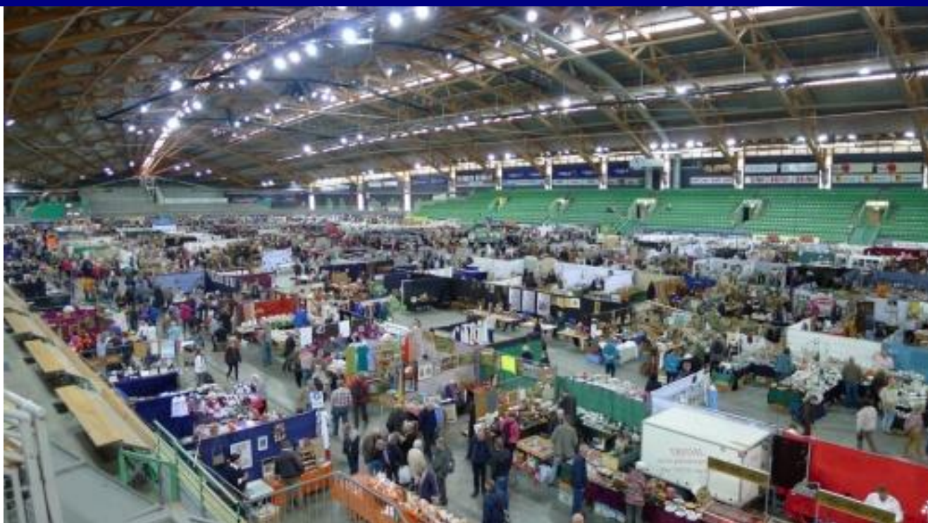
Slik ser det ut i hallen under markedene som holdes This is how it looks in the hall during the fair.

We remind you that the price for renting a table is sponsored by you club.